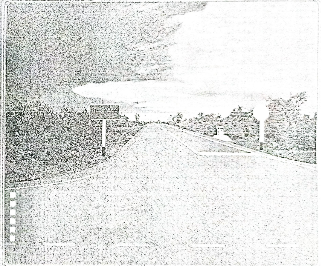
กระทรวงคมนาคม